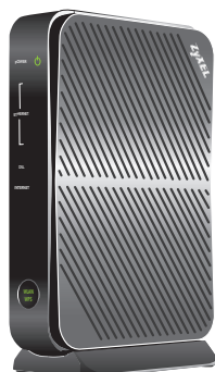
ZyXel 660 (modem)